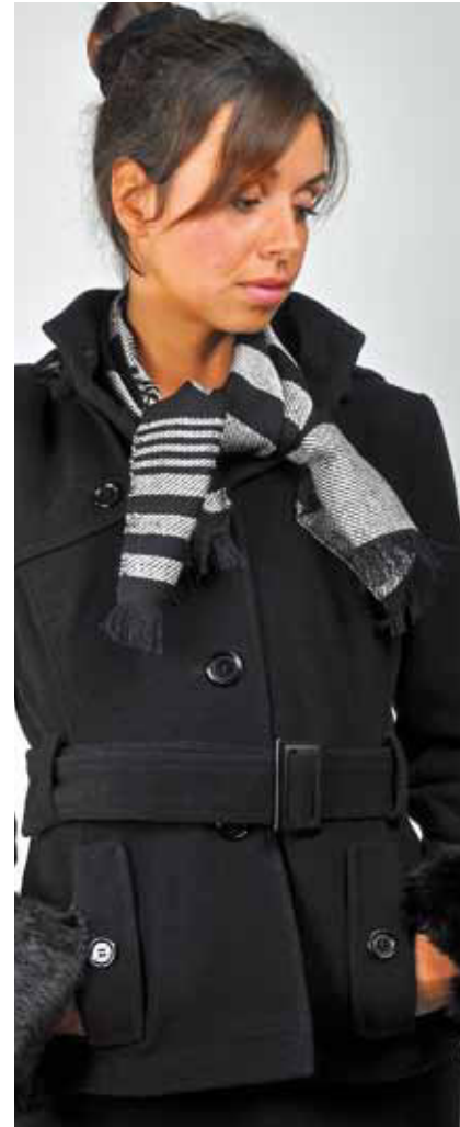
Seidenschal mini, Farbe 32