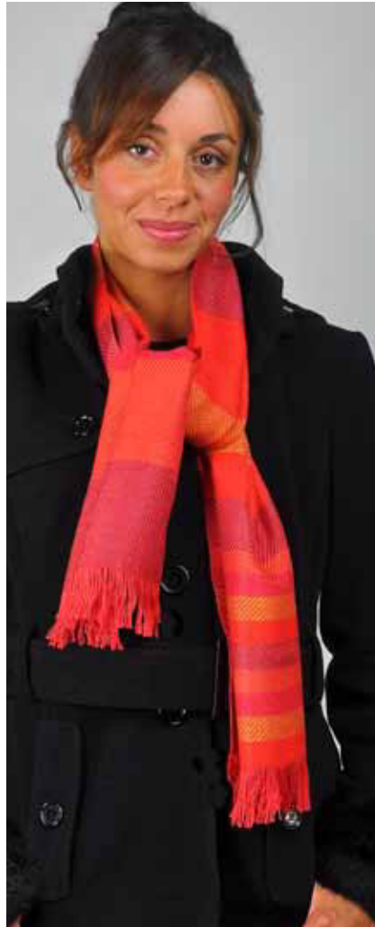
Seidenschal kurz, Farbe 87