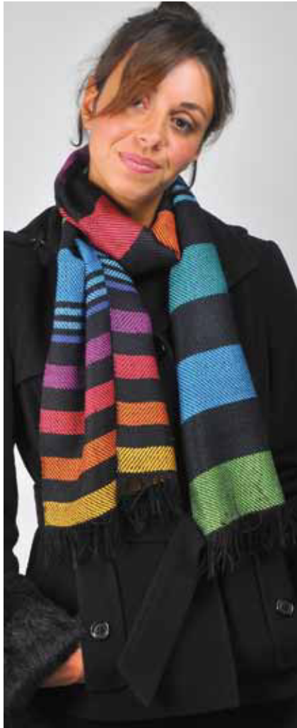
Seidenschal lang, Farbe 77