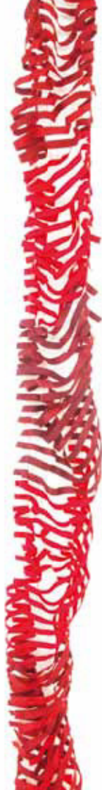
rot - weinrot Bestellnummer 384