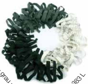
schwarz - grau - weiss Bestellnummer 383 L