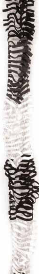
schwarz - grau - weiss Bestellnummer 383