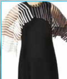
Capelet, grau - weiss Bestellnummer 330C