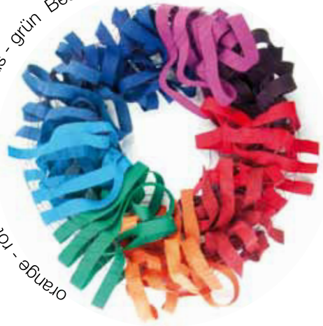
orange - rot - türkis - grün - blau - violett Bestellnummer 381 L