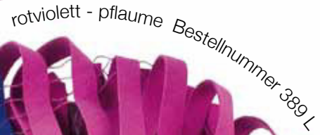
rotviolett - pflaume Bestellnummer 389 L