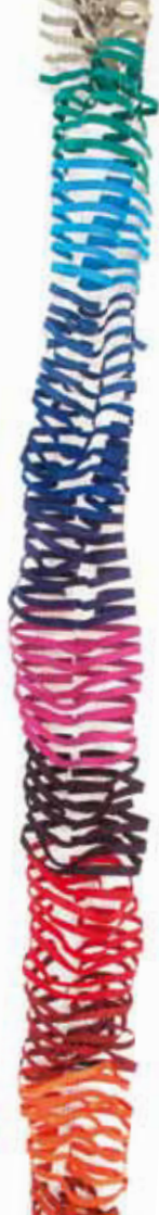
orange - rot - violett - blau - türkis - grün Bestellnummer 381