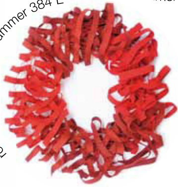
rot - weinrot Bestellnummer 384 L