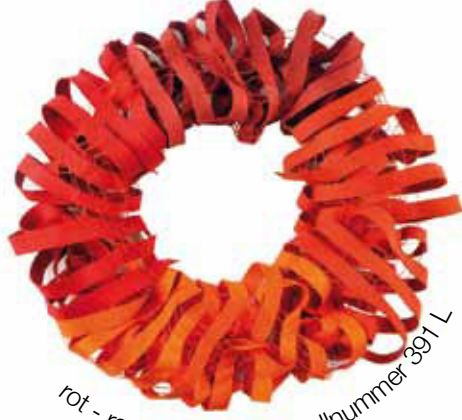
rot - rost - orange Bestellnummer 391 L