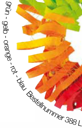
grün - gelb - orange - rot - blau Bestellnummer 388 L