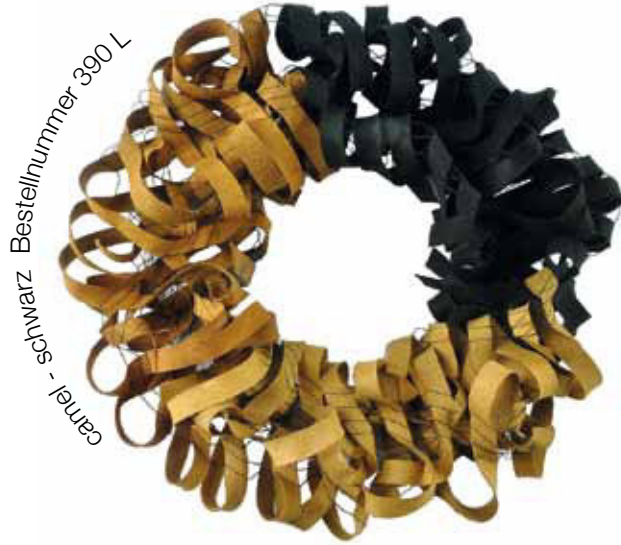
carrel - schwarz Bestellnummer 390 L