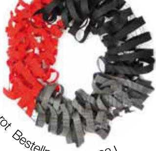
schwarz - grau - rot Bestellnummer 382 L