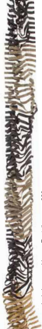
dunkelgrau - schlamm Bestellnummer 380