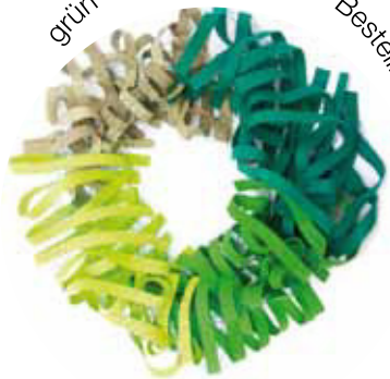
grün - hellgrün - helloliv Bestellnummer 387 L