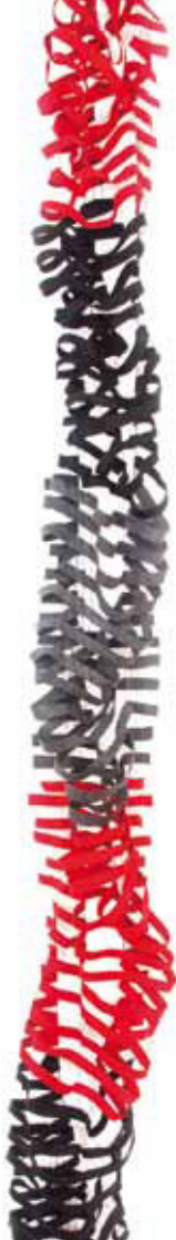
schwarz - grau - rot Bestellnummer 382