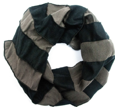
leather look collar, coal + black, order number 672