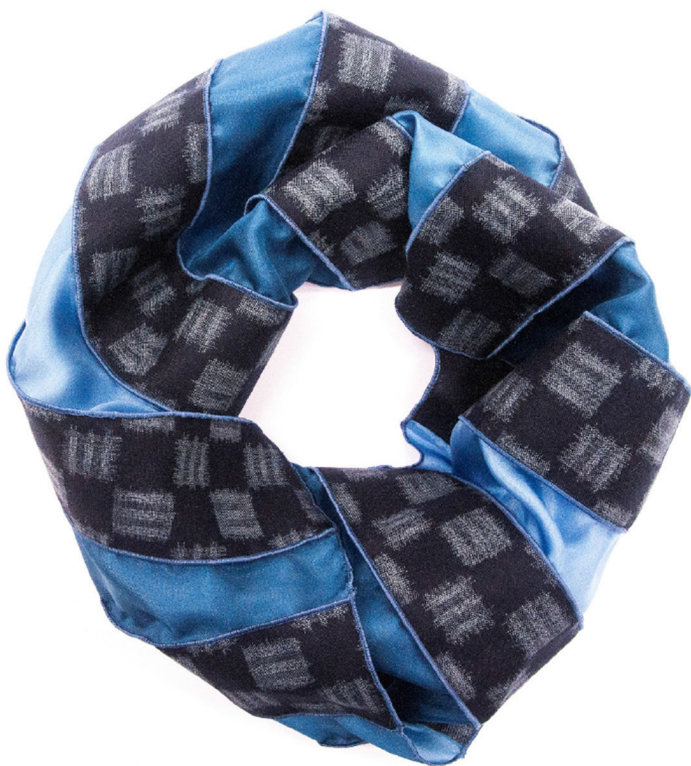
indigo squares, order number 674