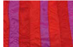
rot pink 628 L