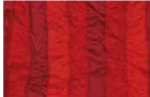
rot 637 L