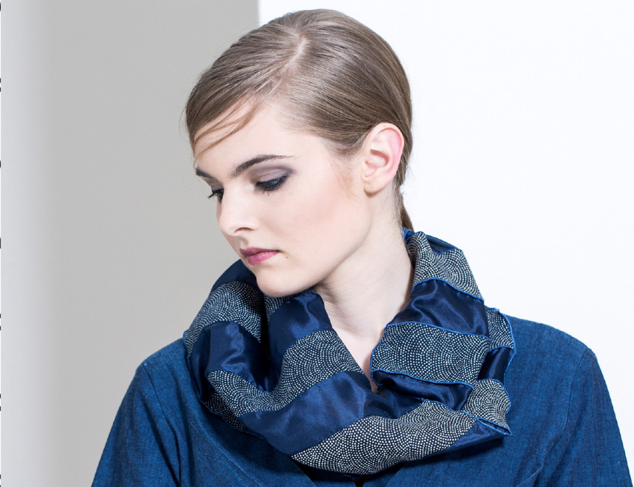
Collar, indigo dots, measurements approx. 30 x 75 cm, order number 675