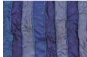
jeans 646 L