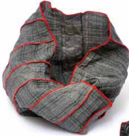
Bestellnummer 656L Material: Microfaser