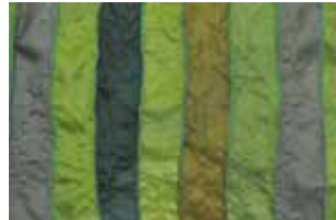
grün 639 L