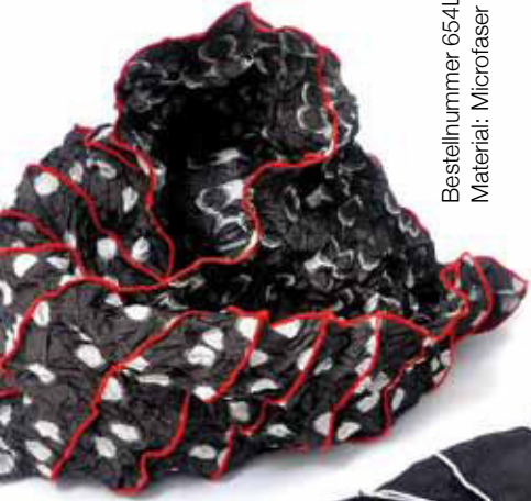
Bestellnummer 654L Material: Microfaser