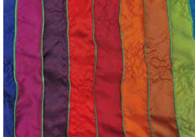
gewürz 648 L