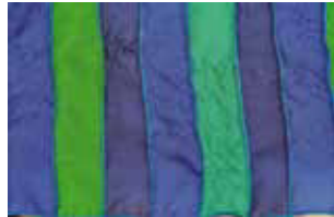
blau grün 644 L