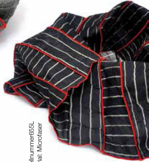
Bestellnummer655L Material: Microfaser