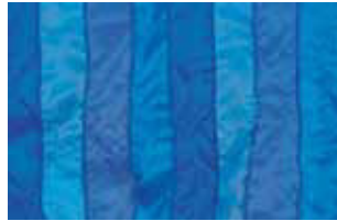
hellblau 634 L