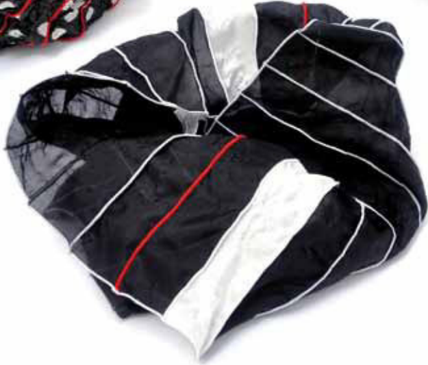
Bestellnummer653L Material: Seide