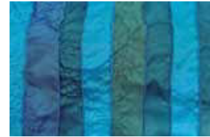
petrol 631 L