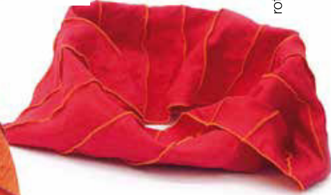
rot Bestellnummer 664