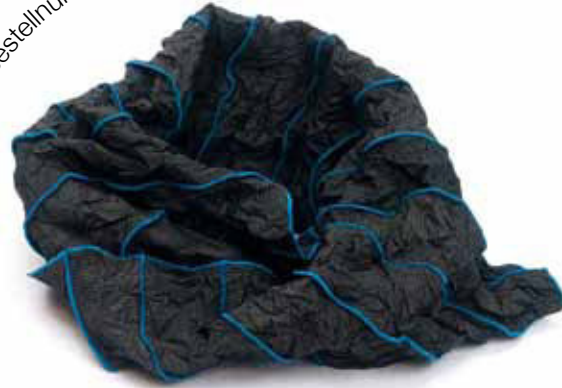
anthrazit - blau Bestellnummer 659