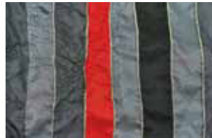
grau rot 645 L