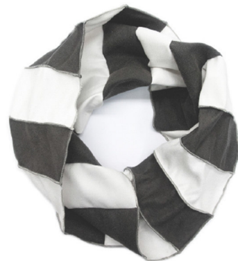
leather look collar, grey + white, order number 673