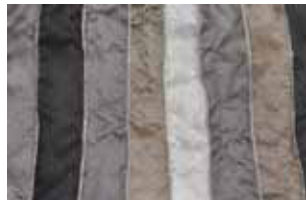
natur 633 L