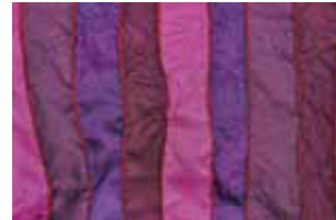
pflaume 630 L