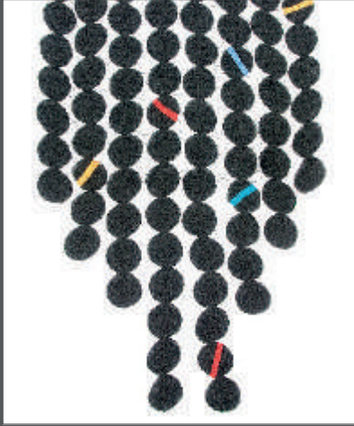
schwarz - bunt Bestellnummer 248C

Here, it is once again the lasercut ribbons of material that give the basic structure to the permeable weave. Ribbons of sequentially connected circles are held together with finely sewn lines. What comes into being are interesting throw-overs, breezily sitting on the wearer. These capeltes are particularly decorative and lend simple outfits a breath of extravagance.