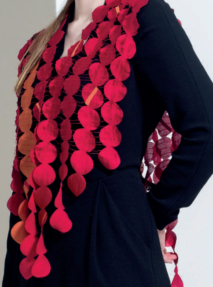
rot - rostorange Bestellnummer 247C

Measurements: approx. 38 cm x 104 cm Material: microfiber