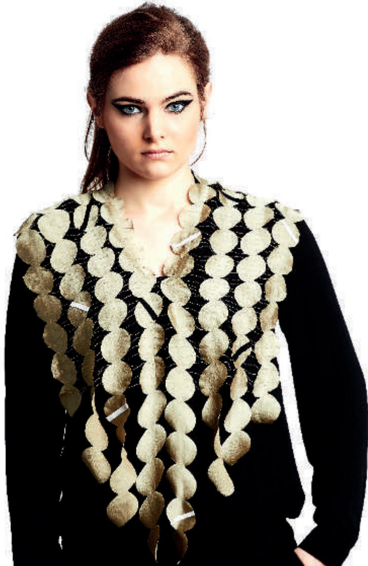
rot - pink - orange Bestellnummer 252C