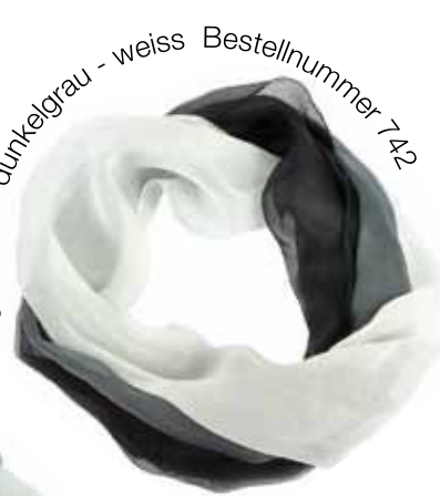
schwarz - dunkelgrau - weiss Bestellnummer 742