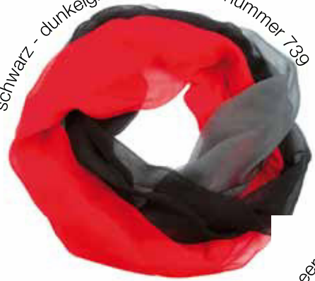
schwarz - dunkelgrau - rot Bestellnummer 739