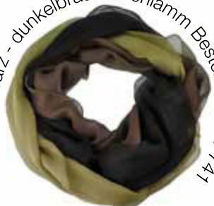
schwarz - dunkelbraun - schlamm Bestellnummer 741