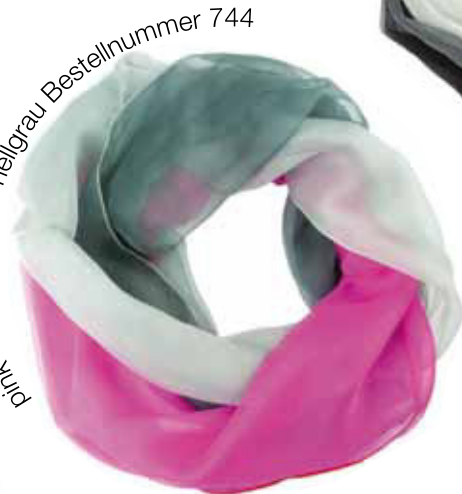
pink - dunkelgrau - hellgrau Bestellnummer 744