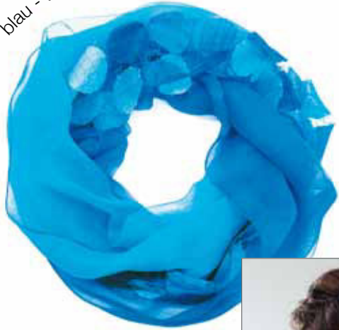
blau - türkis Bestellnummer 755