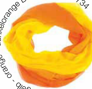
gelb - orange - dunkelorange Bestellnummer 734