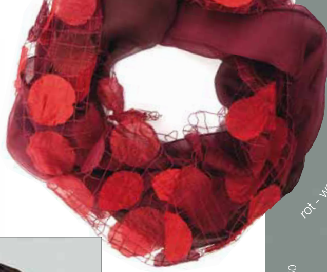
rot - weinrot Bestellnummer 752