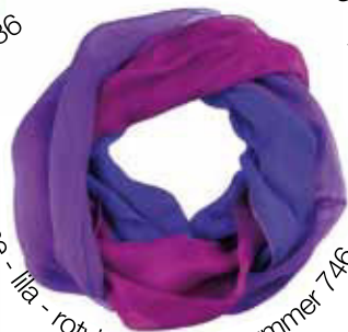
blauwe - lila - rotviolett Bestellnummer 746