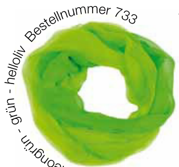
neongrün - helloliv Bestellnummer 733