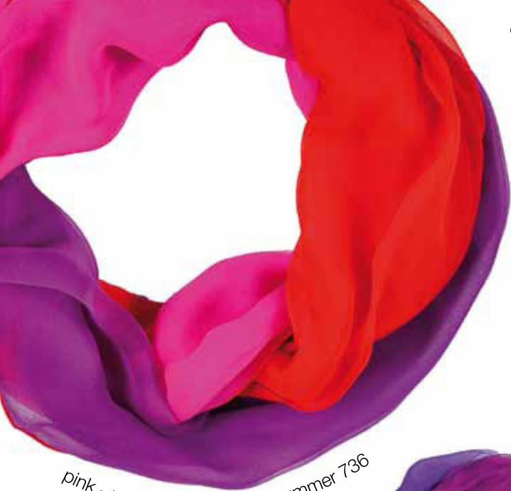
pink - rotviolett - rot Bestellnummer 736