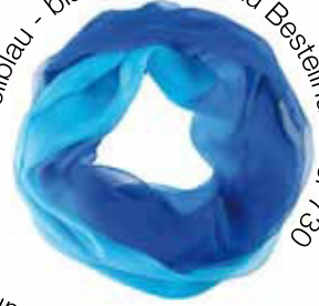
hellblau - blau - dunkelblau Bestellnummer 730