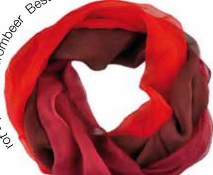
rot - weinrot - brombeer Bestellnummer 737