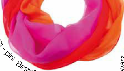
orange - rot - pink Bestellnummer 735