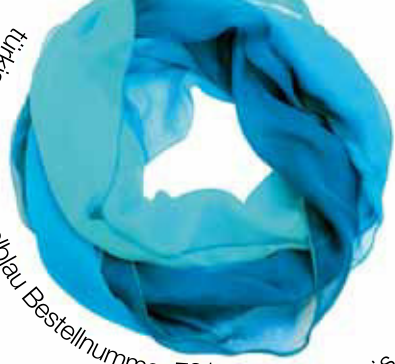
türkis - blau - dunkelblau Bestellnummer 731