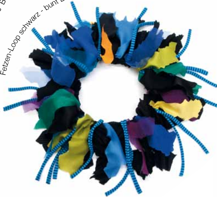
„Leder“ Loop schwarz - bunt Bestellnummer 392