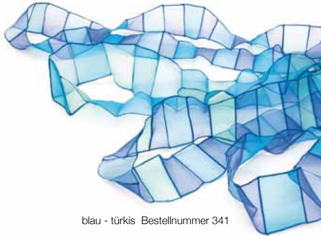
blau - türkis Bestellnummer 341

Dieser Hals- und Schulterschmuck besteht aus transluzenter Organza Seide. Fast schwebend umspielen vier zusammengehaltene Stoffbänder den Körper. Ein textiles Objekt, das sich auf unterschiedliche Art drapieren lässt. Maße: ca.25 x 120 cm Material: Organza Seide