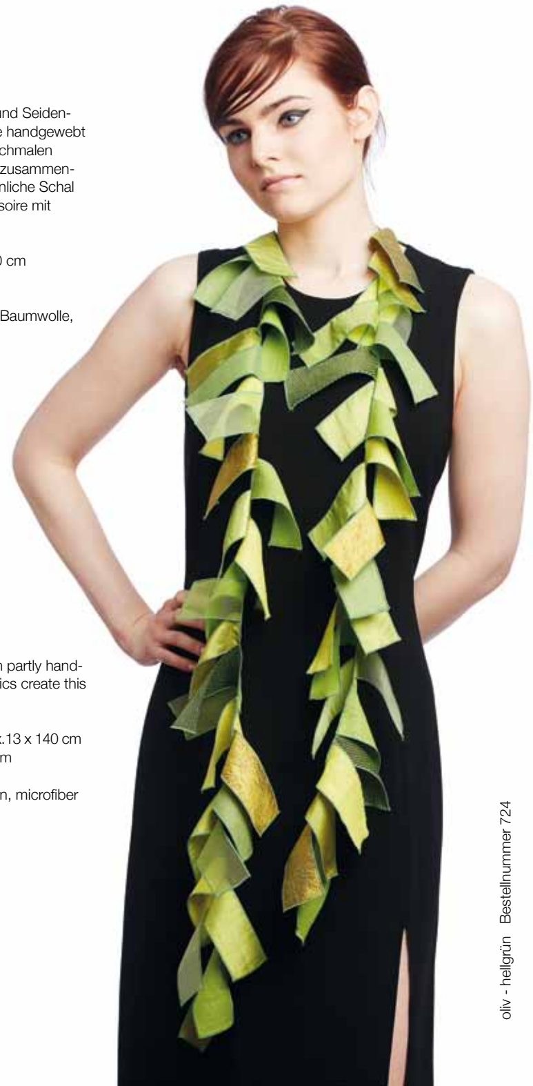
oliv - hellgrün Bestellnummer 724

Material: linen, silk, cotton, microfiber