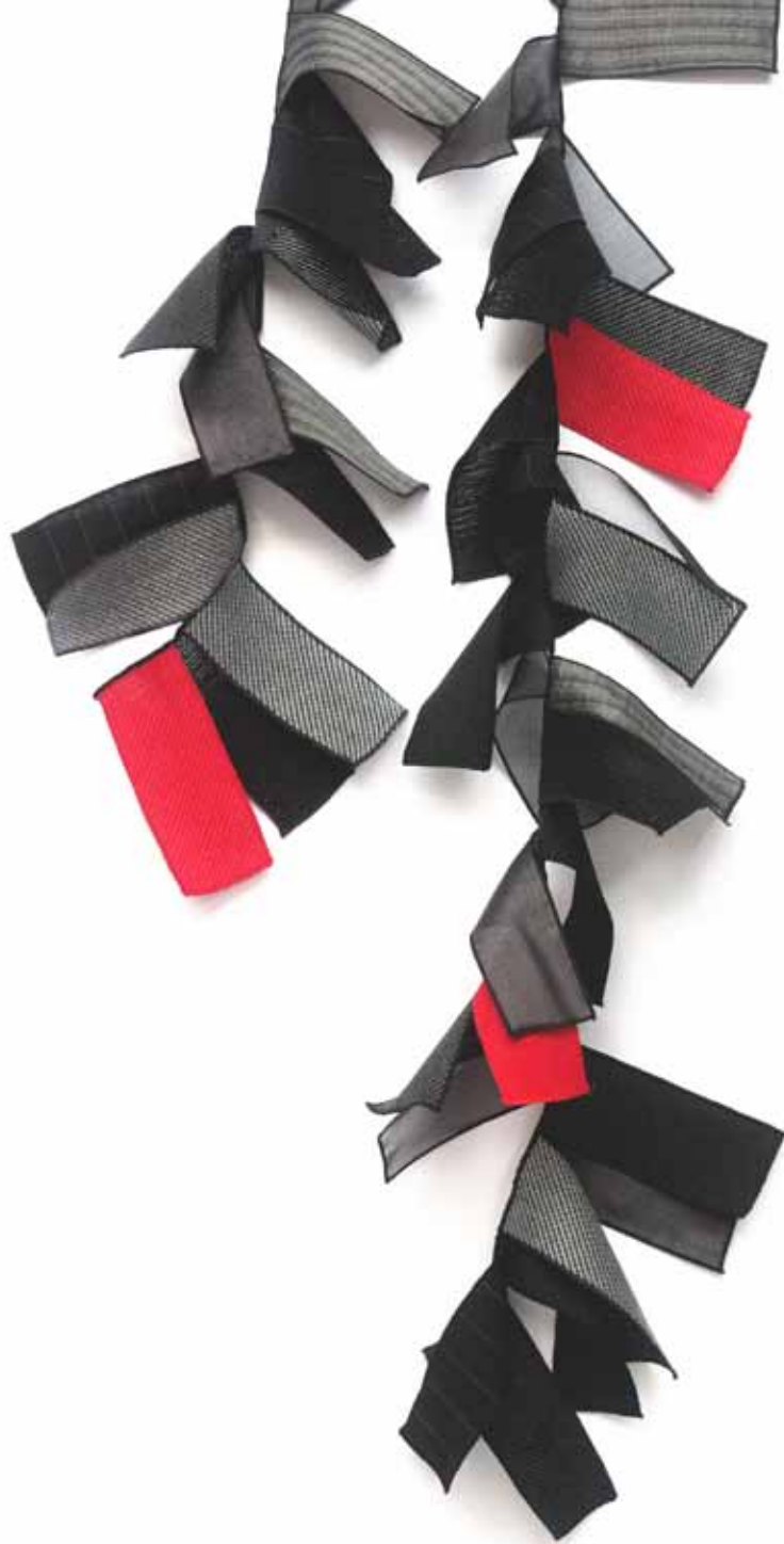
schwarz - grau -rot Bestellnummer 725

Rechtecke aus Leinen- und Seidenstoffen, von denen einige handgewebt sind, wurden an einem schmalen Band wie eine „Flagline“ zusammengenäht. Dieser ungewöhnliche Schal ist ein effektvolles Accessoire mit Unikatcharakter.