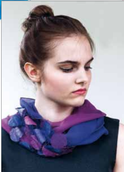
Tragevariante halsnah pflaume Bestellnummer 751