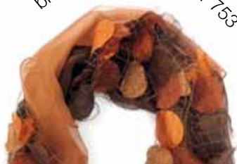
braun Bestellnummer 753

The transformation scarf is made from three interlinked fabric loops. It can be worn elegantly as an extended loop or tightly around the neck. Dimensions: approx. 100 x 18 cm Material: chiffon silk, pongé silk