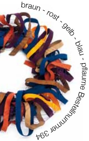
braun - rost - gelb - blau - pflaume Bestellnummer 394