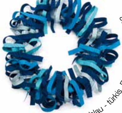
„Leder“ Loop blau - türkis Bestellnummer 393