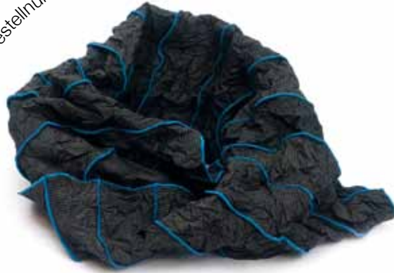
anthrazit - blau Bestellnummer 659